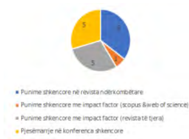
Fig.13. Rrethi me të dhëna mesatare për punimet dhe konferencat - 2016/2017, Biologji