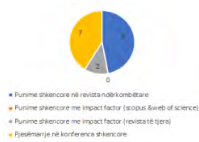
Fig.11. Rrethi me të dhëna mesatare për punimet dhe konferencat - 2017/2018, Gjeografi