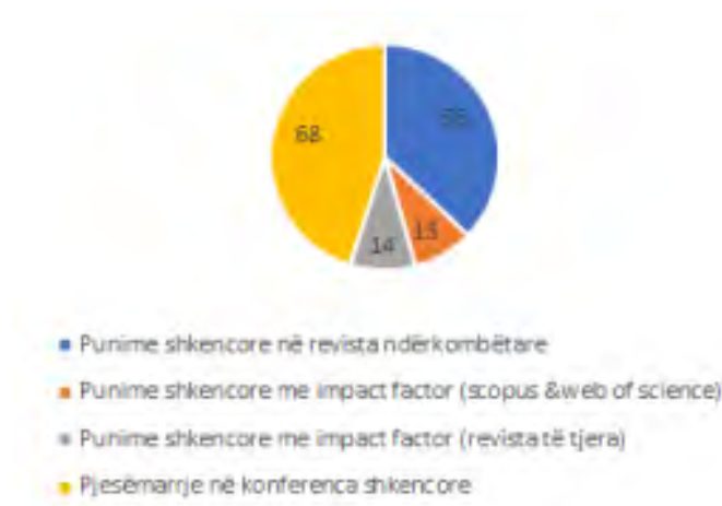
Fig.3. Rrethi me të dhëna mesatare për punimet dhe konferencat - 2018/2019, FSHMN

Në vazhdim do të japim veprimtarinë shkencore të stafit akademik për çdo program studimor në veçanti.