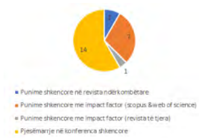
Fig. 9. Rrethi me të dhëna mesatare për punimet dhe konferencat - 2018/2019, Fizikë