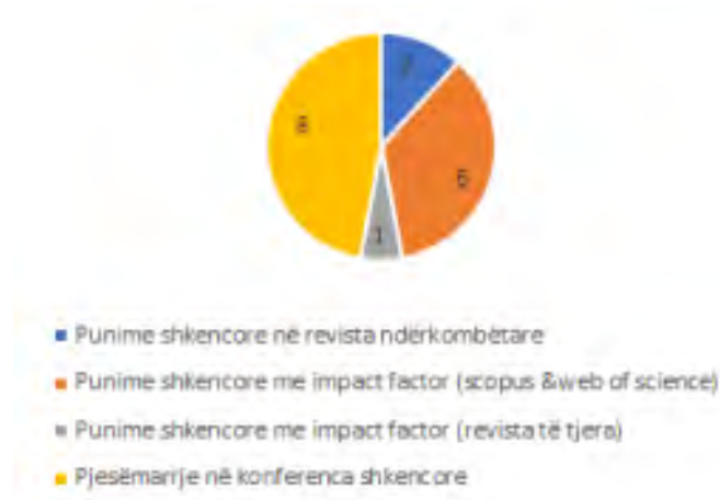
Fig.8. Rrethi me të dhëna mesatare për punimet dhe konferencat - 2017/2018 - Fizikë