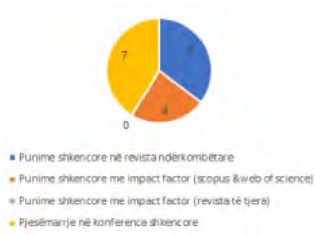
Fig.7. Rrethi me të dhëna mesatare për punimet dhe konferencat - 2016/17 – Fizikë