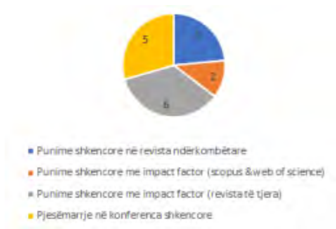
Fig.14. Rrethi me të dhëna mesatare për punimet dhe konferencat - 2017/2018, Biologji