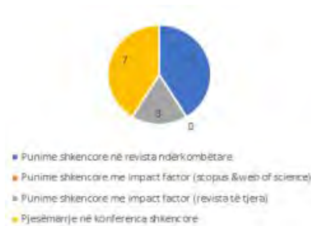
Fig.12. Rrethi me të dhëna mesatare për punimet dhe konferencat - 2018/2019, Gjeografi