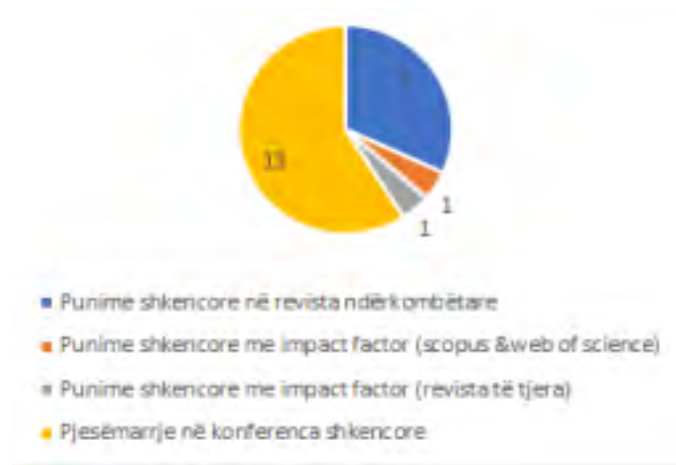
Fig.5. Rrethi me të dhëna mesatare për punimet dhe konferencat - 2017/2018 - Kimi