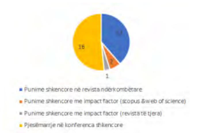
Fig.6. Rrethi me të dhëna mesatare për punimet dhe konferencat- 2018/2019 - Kimi