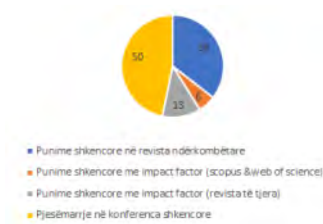
Fig.2 Rrethi me të dhëna mesatare për punimet dhe konferencat - 2017/2018, FSHMN

revista me impactfactor (scopus&webofscience) dhe rreth 13 punime janë në revista të tjera me impactfactor (fig.2), si dhe rreth 50 prezantime në konferenca ndërkombëtare.