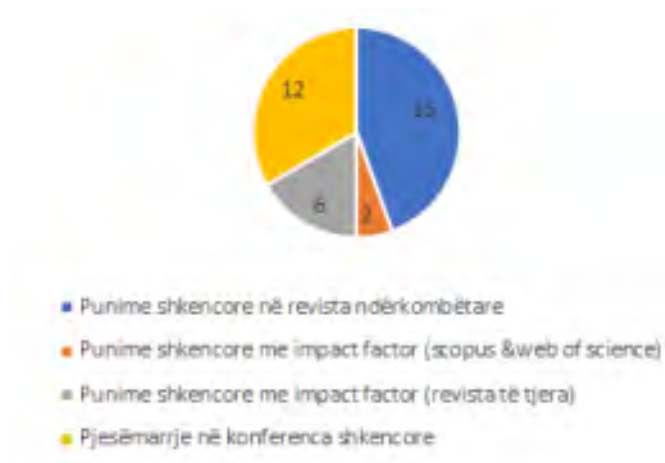
Fig.4. Rrethi me të dhëna mesatare për punimet dhe konferencat - 2016/2017 - Kimi