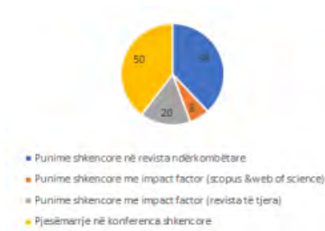
Figura 1. Rrethi me të dhëna mesatare për punimet dhe konferencat - 2016/2017, FSHMN

konferenca bëhet me nga dy deri tre bashkautorë dhe këto bashkëpunime janë në mes kolegëve të të njëjtit program studimor apo fakultet, atëherë për të marrë një pasqyrë sa më reale, të dhënat e mësipërme i pjesëtojmë me 2.5. Kështu marrim: rreth 76 punime gjithsej, prej të cilëve rreth 48 punime janë në revista shkencore ndërkombëtare, rreth 8 punime në revista me impactfactor (scopus&webofscience) dhe rreth 20 punime janë në revista të tjera me impactfactor (figura.1), si dhe rreth 50 prezantime në konferenca ndërkombëtare.